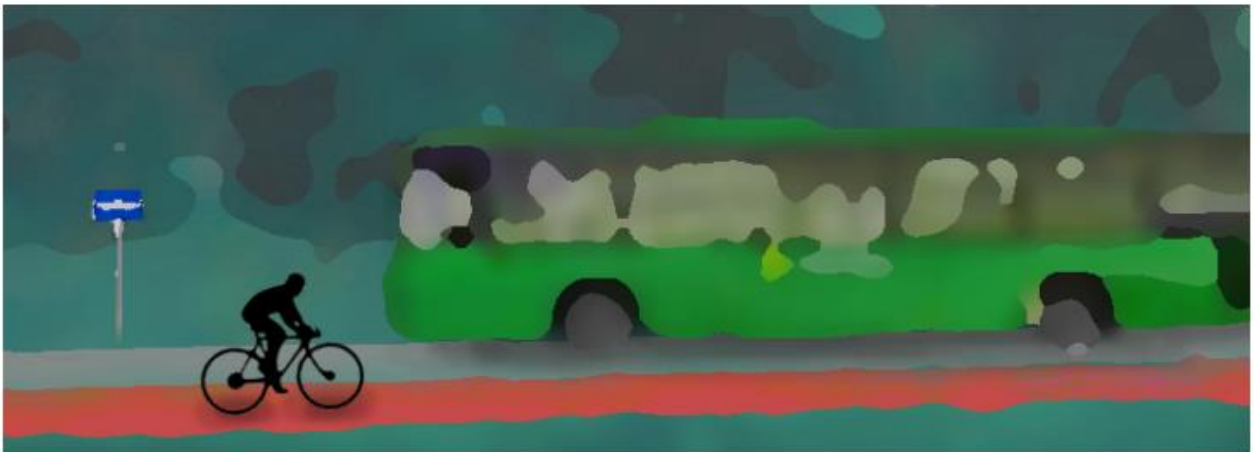
Illustrasjon: Conrad Bowen (Vägen vgs)