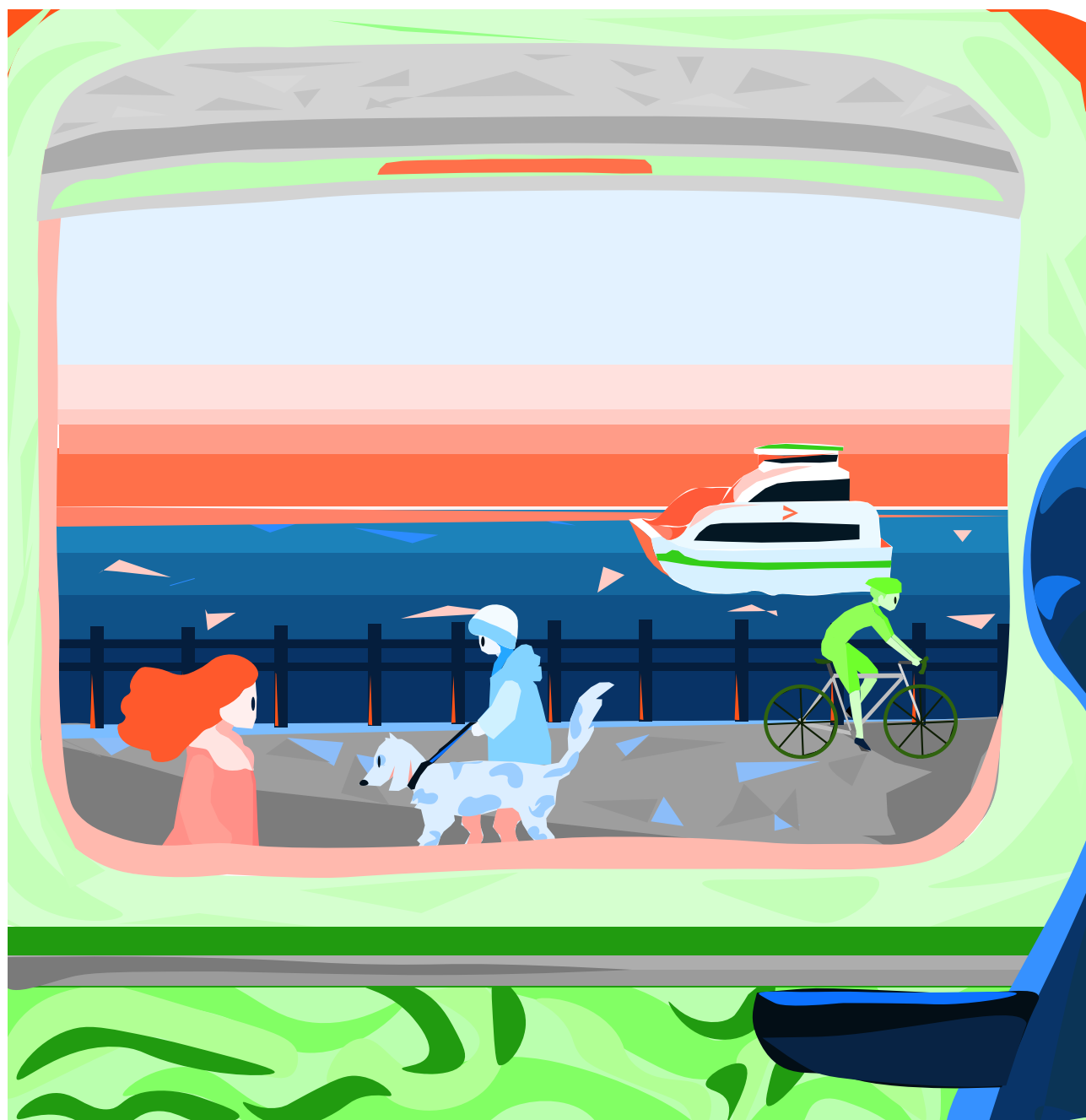
Illustrasjon: Hertiane Pampag Silvano (Vågen vgs)