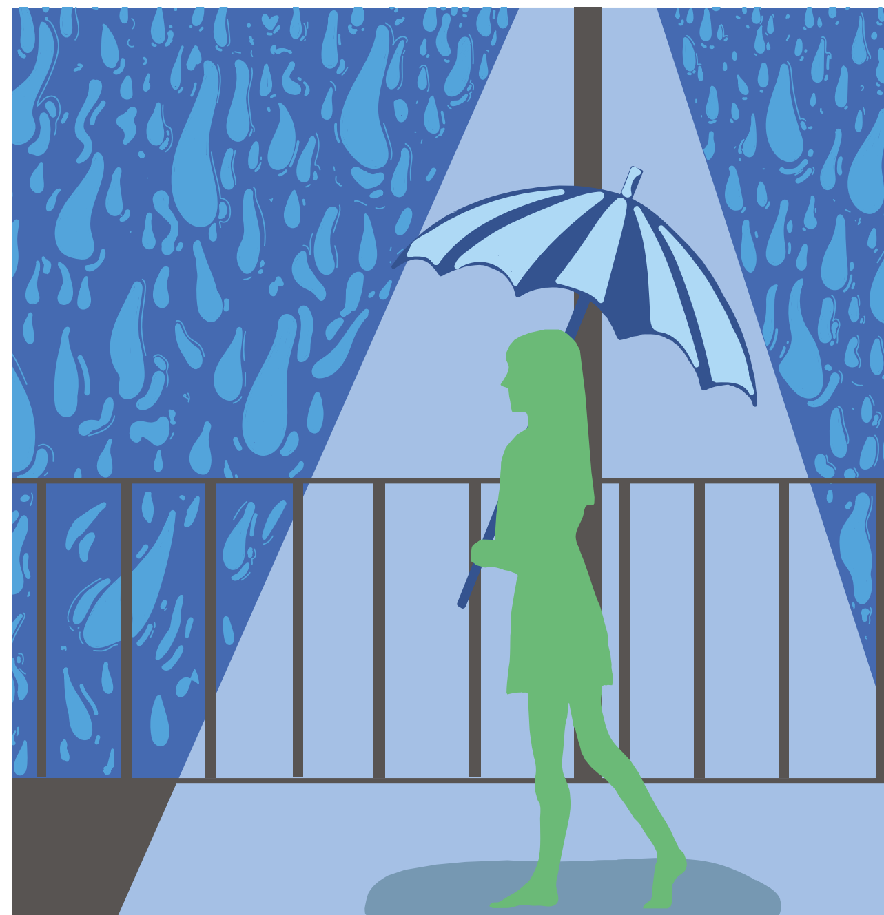
Illustrasjon: Victoria Eide (Vågen vgs)

* Prosjektet planlegges finansiert med statlige programområdemidler og spilles derfor inn til statsbudsjettet.