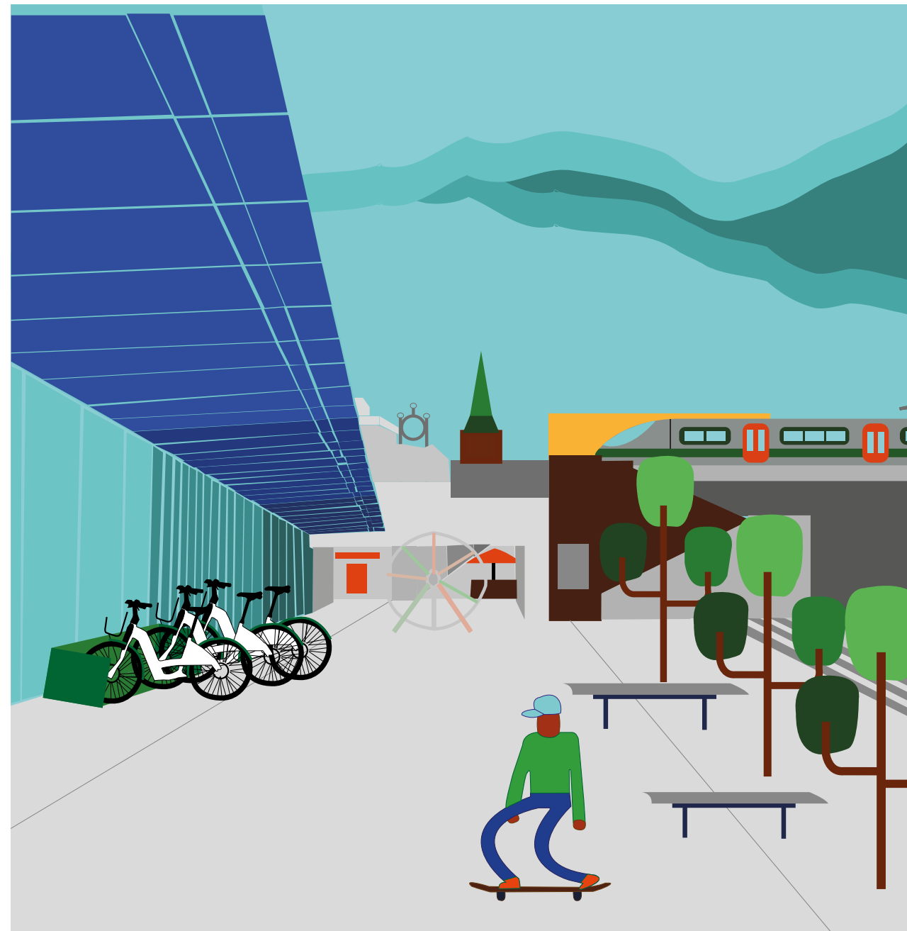
Illustrasjon: Dina Sæland (Vågen vgs)

Sandnes stasjon inneholder oppgraderingstiltak som skal bidra til å etablere gode overgangsløsninger mellom jernbane, bussvei og annen kollektivtrafikk til og fra Sandnes stasjon og Ruten. Oppgraderingen består også i å sikre at Sandnes stasjon skal få så god universell utforming som mulig.