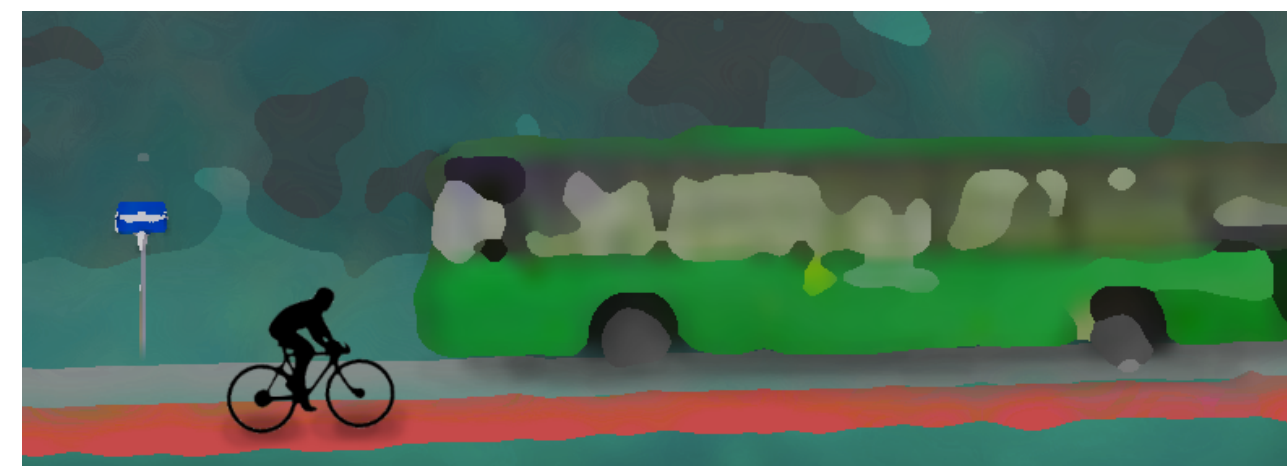
Illustrasjon: Conrad Bowen (Vågen vgs)