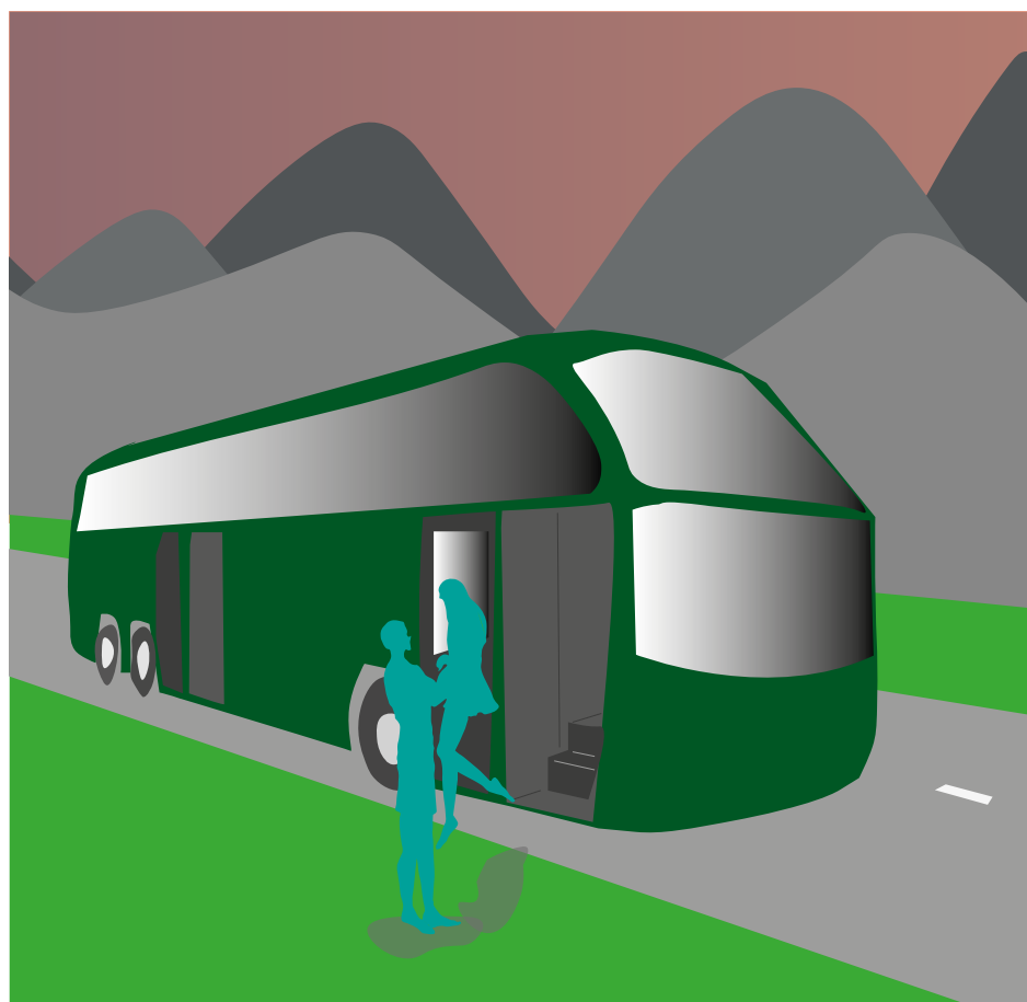
Illustrasjon: Emilie Thorsen (Vågen vgs)

Innenfor programområdene i 2023, er det i stor grad planlagte og påbegynte prosjekter som er overført fra tidligere, samt gjeldende handlingsprogram (2023-2026) som er med.