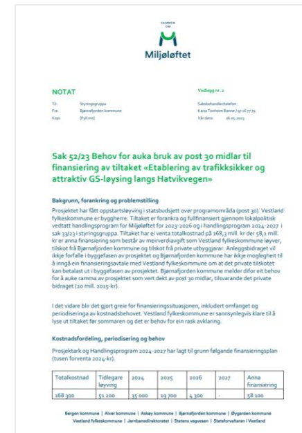
EKSEMPEL PÅ NOTAT (BERGEN)