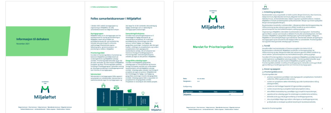
INFORMASJON TIL DELTAKERNE (BERGEN)