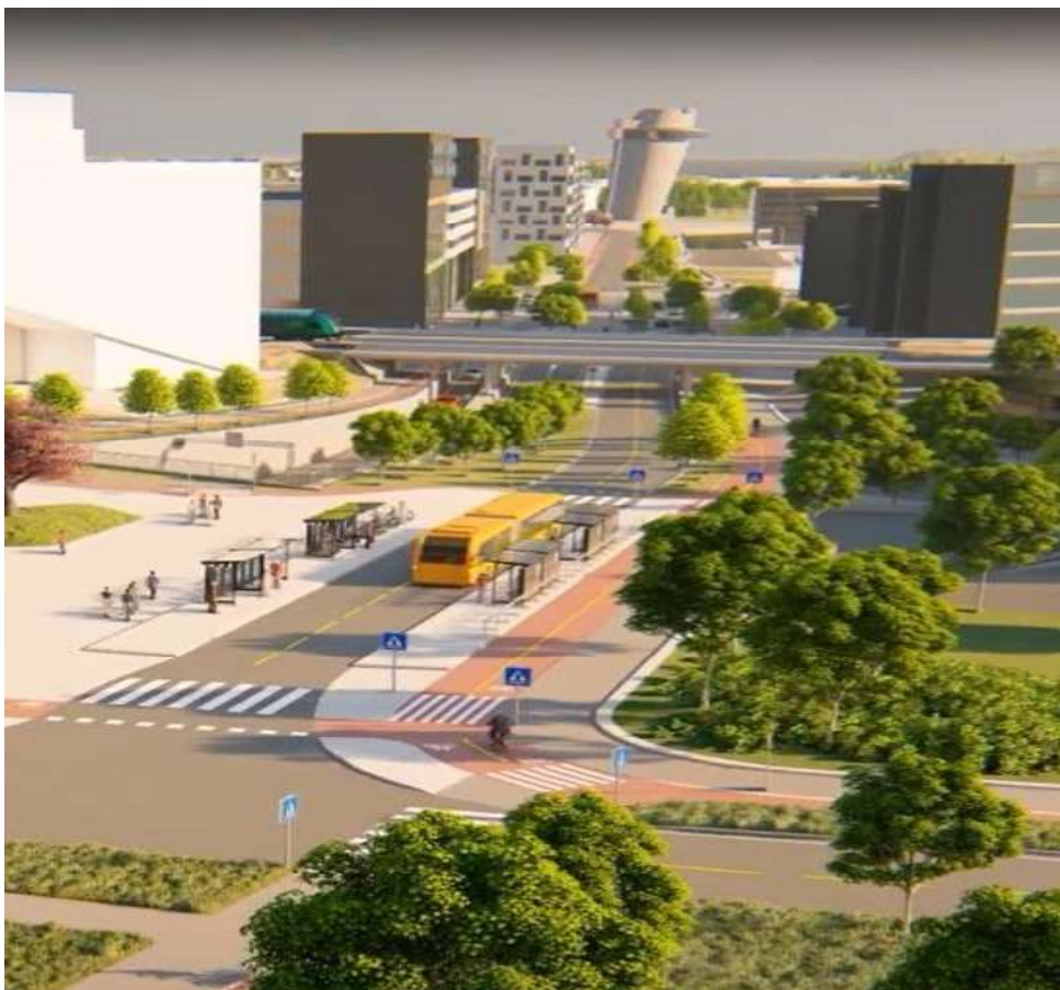
Bilde 6. Fv. 44 Bussveien Stasjonsveien – Gauselvågen, med det skjeve tårn i bakgrunnen

Enheten har, og vil fortsette å ha, et sterkt fokus på kostnader.