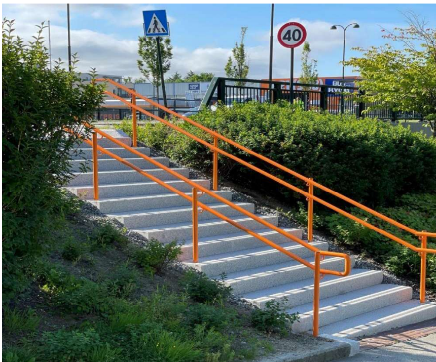
Bilde 8. Bymiljøpakken- Fv 44 Marieroveien – Trapp Mariero.

De mindre trafikksikkerhetstiltakene fra 1.kvartalsrapport er samlet inn i prosjektet Bymiljøpakken Trafikksikkerhet ungdomsskoleveg.