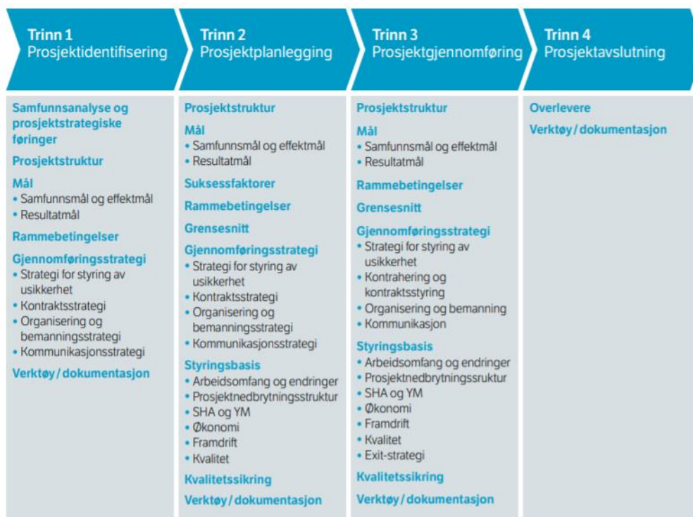
Figur 6: 4-trinns prosjektstyringsmodell med tilhørende aktiviteter

Gjennom byvekstavtalen har partene forpliktet seg til å styre porteføljen etter prinsippene om god porteføljestyling. For å kunne ha en totaloversikt over porteføljen og økonomi i Bymiljøpakken, må styringsgruppen involveres i prosjekteiers ulike faser av gjennomføringen av prosjektet. Til dette formålet er det en svært forenklet versjon av R760 som brukes. De ulike fasene er definert gjennom R760 som følger: