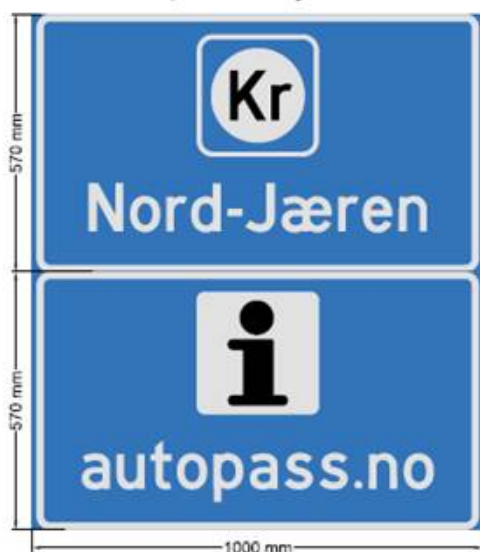
Skilt nr. 2, teksthøyde 105mm